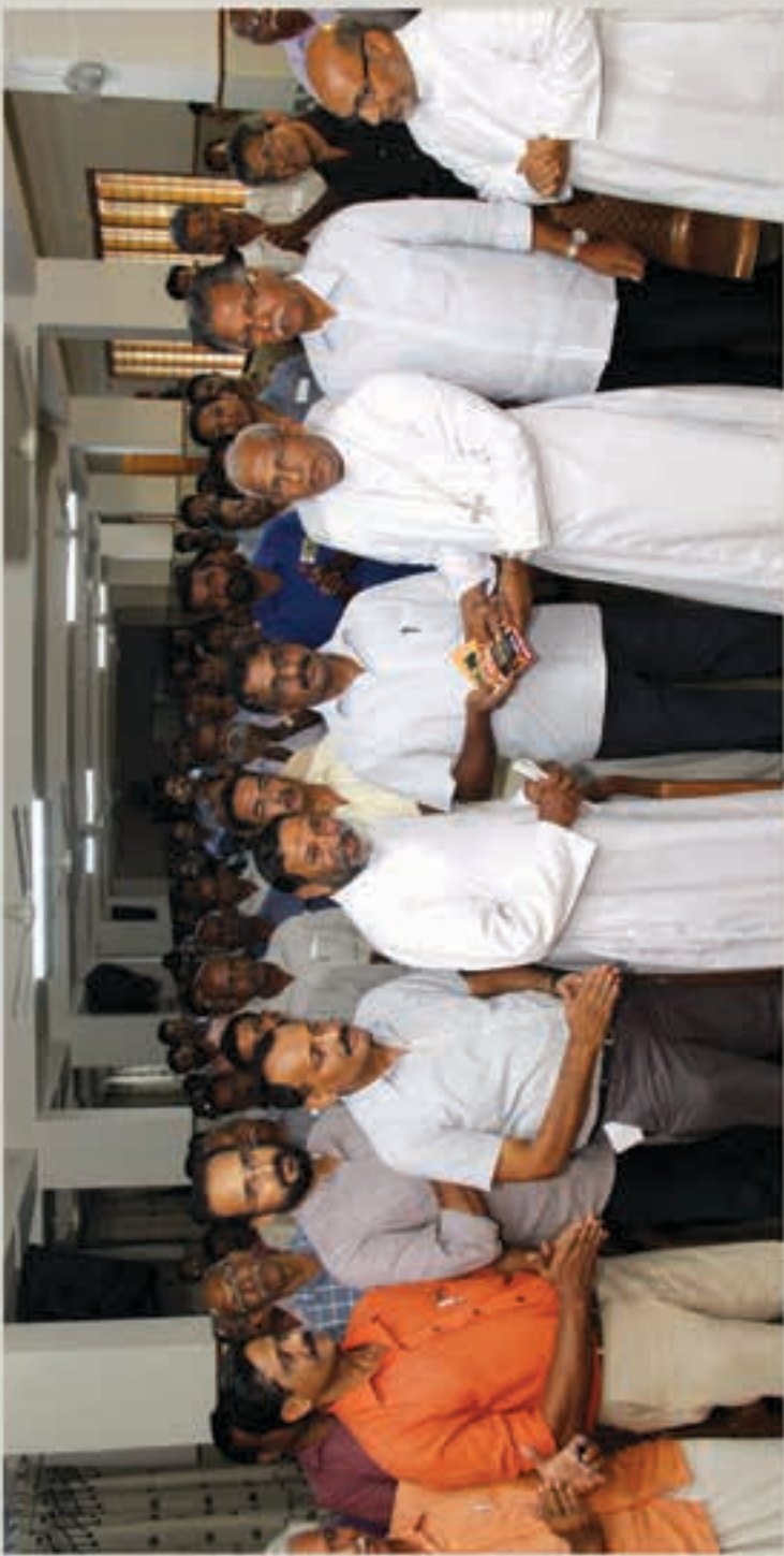
ബോൾ നത്താലെ 2018 പ്രളയ ബാധിതർക്ക് കൈത്താങ്ങായി അതിരൂപതയിലെ 250 ഇടവകകളിൽ നിന്നും ജോതിമതഭദ്രമെന്യേ രണ്ട് ഭവനങ്ങൾക്കു വീതം 25 ലക്ഷം രൂപയുടെ ധനസഹായ വിതരണം ഓർ ആൻഡ്രാസ് താഴെത് പിതാവ് ഉദ്ഘാടനം ചെയ്യുന്നു.