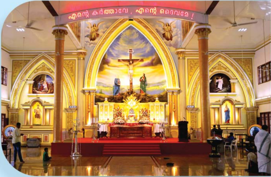
കോട്ടപ്പടി സെന്റ് ലാസർ പള്ളിയുടെ നവീകരിച്ച മദ്ബഹ