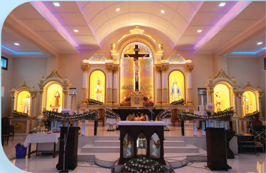
കുന്നംകുളം (ചിറളയം) സെന്റ് സെബാസ്റ്റ്യൻ പള്ളിയുടെ നവീകരിച്ച മദ്ബഹ