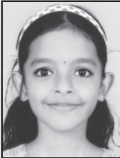
ALENA E. S. LITTLE FLOWER CGHS MAMMIYUR