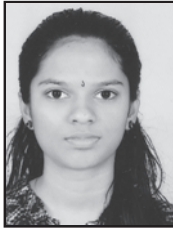
ARDHRA T.G ST. THERESA'S G.H.S BRAHMAKULAM