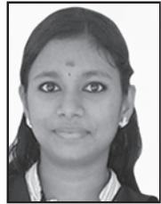
CHINCHILA M. S. LITTLE FLOWER C.G.H.S.S MAMMIYOOR Std. XII