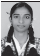
Aparna Raj Lourde Matha Eng. HSS Cherpu