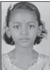
St. IV Anet Byju St. Sebastians Eng.LPS, Nellikunnu